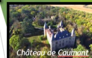
Château de Caumont